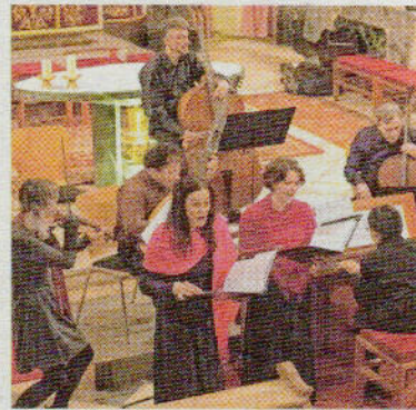
Der Auftakt der Tiroler Barocktage ist gelungen.