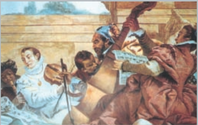
Giovanni Battista Tiepolo (1696 - 1770)

19 luglio 2002, San Vigilio e 20 luglio 2002, Casa Ragen, Brunico