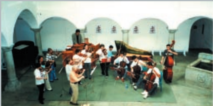
Proben während der Akademie 2001 / Prove d'orchestra Accademia 2001

Attualmente, accanto all' attività solistica, si dedica intesamente all' ensemble "Il Proteo", del quale è fondatore. Sergio Azzolini ha dimostrato da diversi anni un particolare interesse per la musica antica eseguita con strumenti d'epoca e collabora regolarmente con l' Ensemble Baroque de Limoges diretto da Christophe Coin. Dopo una lunga attività pedagogica all'università musicale di Stoccarda è divenuto nel 1998 insegnante di fagotto e musica da camera all'università musicale di Basilea.