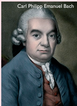
Carl Philipp Emanuel Bach